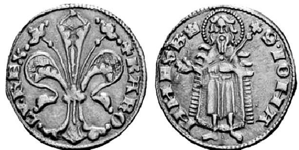
Золотий форинт Карла Роберта Анжу

Виклад основного матеріалу. Країни Центральної Європи, насамперед, Угорщина, з XIV століття займають провідну роль не тільки в центральноєвропейському регіоні, але і в Європі в цілому. Фактично, за ініціативи представника династії Анжу, Карла Роберта, після вимирання династії Арпадів (1301 р.), було використано політичний вакуум. Створення центральноєвропейської унії за ініціативи угорського короля Карла Роберта спиралось на сталі династичні традиції, вмилу державну організацію політичної влади, торгово-економічну співпрацю, зовнішньополітичну стабільність. Зокрема, син Карла Роберта, Перший Лайош (Великий) (1342–1382 рр.), який стає також і королем Польщі і надалі посилює соціально-економічний розвиток та міжнародне визнання Угорського королівства у період середньовіччя. У 1378 році здійснено реформу управління містами [14, р. 241], міста не тільки політично, але і економічно підсилюють владу короля, який дарує привілеї декільком містам, як, наприклад, Подолінну, Кошице, Дебрецену, а також шахтарським містам Надьбаня та Залатна [16, р. 53].