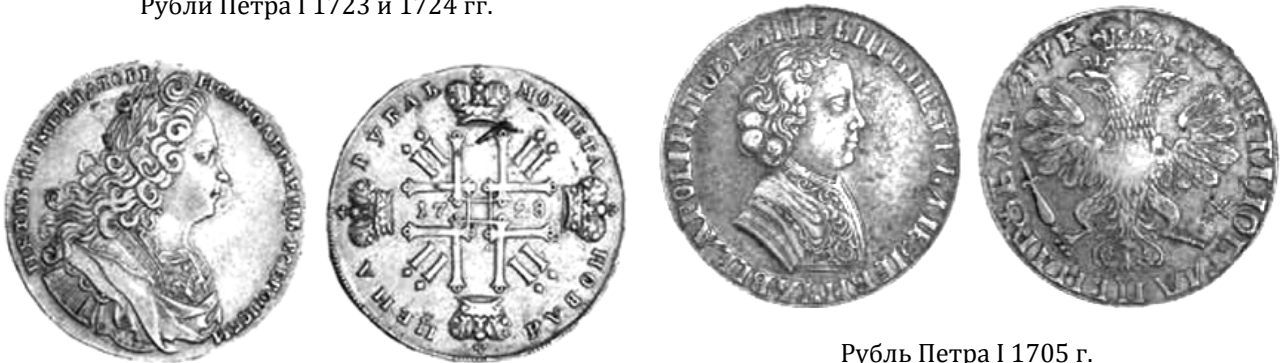
Рубль Петра I 1705 г.