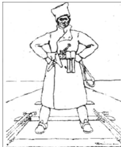
Отаман Григор'єв. Григор'євець (Із книги W. Fest «Nikolajew, der letzte deutsche Posten am Schwarzen Meer», 1919).