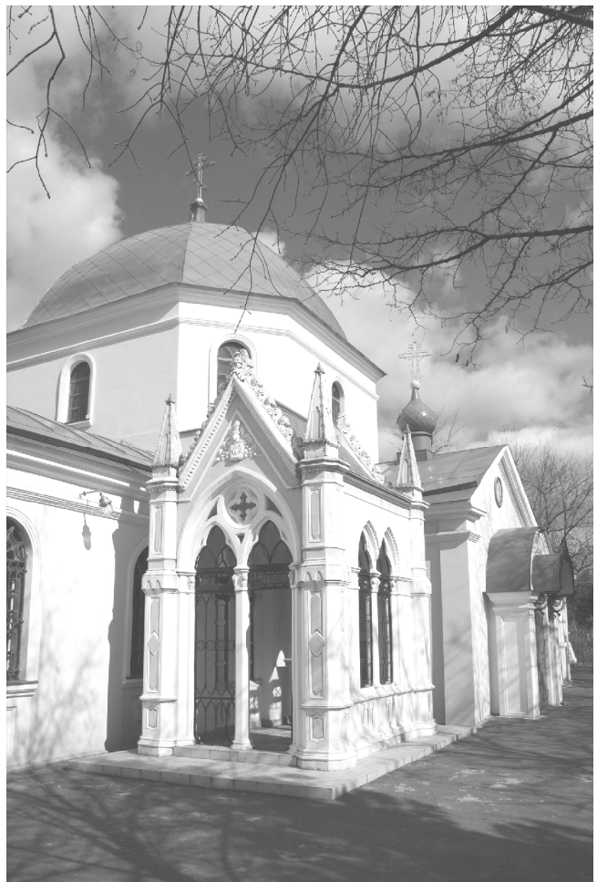
Фото. Каплиця Аркасів. Загальний вигляд

Відносно похованих під цією каплицею людей, існує досить багато публікацій, серед яких найбільш змістовною, на наш погляд, є монографія Т. В. Березовської [6]. Автор не