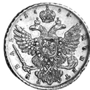
Рубли Анны Иоанновны 1738 и 1739 гг.