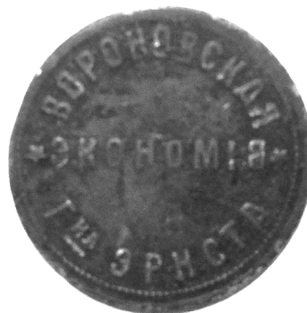
Вороновская бона. Обратная сторона