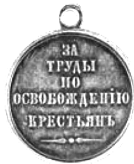
Медаль Александра II 1861 г. за труды по освобождению крестьян