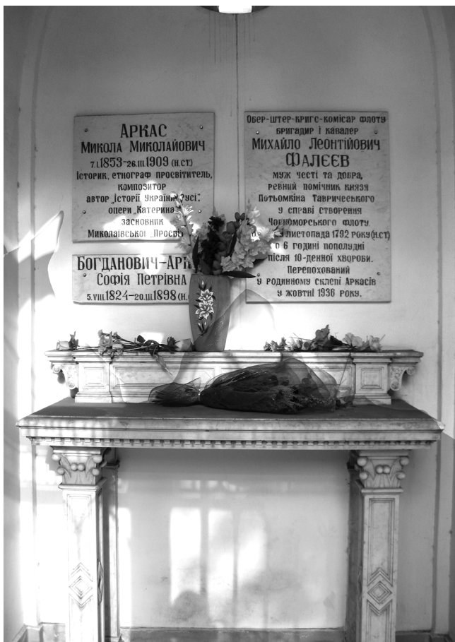
Фото. Мармурові епітафії каплиці