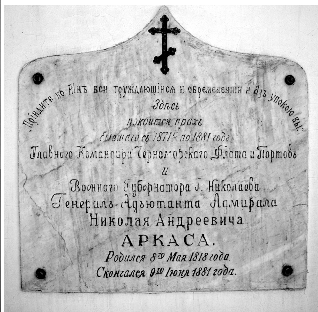
Фото. Епітафія на честь М. А Аркаса