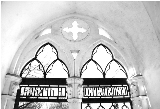
Фото. Внутрішній вигляд каплиці