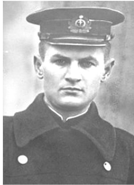
Костянтин Федорович Ольшанський

Перед початком Одеської операції перевага була на боці радянських військ (1, 266–267).