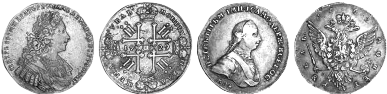
Рубли Петра II 1728 и 1729 г.