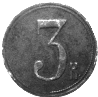
Вороновская бона. Лицевая сторона. Из частной коллекции