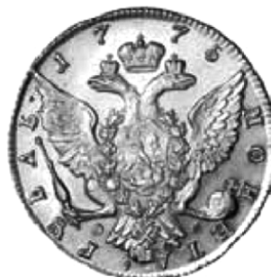
Рубли Елисаветы 1756 г. и Екатерины II 1775 г.