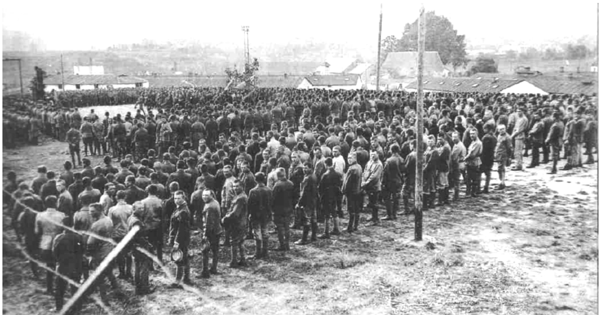
«Українська бригада в Німецькім Яблонні (Чехія)». Церковна служба на таборовому плаці 3 серпня 1919 р.

Тут лише відзначимо, що важливою віхою в історії визвольних змагань 1917-1921 рр. стало об'єднання в липні 1919 р. Галицької армії та збройних сил Директорії. Під тиском поляків Галицька армія ЗОУНР відійшла на територію між Стрипою та Збручем. Однак частина галицьких військ у кількості біля 4000 військових, була відрізана поляками від основних сил і вимушена перейти через Карпати на територію Чехословаччини, де її було інтерновано в таборі біля містечка Німецьке Яблонне [32].